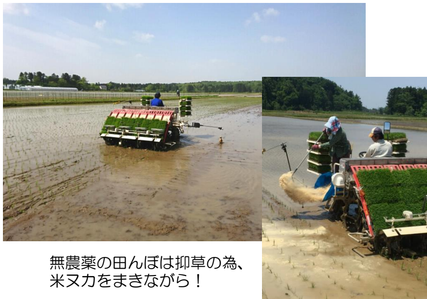
無農薬の田んぼは抑草の為、米又力をまきながら！

田植え終わりましたー！＼(^o^)/。5月7日から始め、25日で終了～。親父が代掻き、僕と嫁さんが田植え組。今年は田んぼが深く埋まることもあって大変でしたが、怪我なく無事に終わったのがなによりですね。この時期は日の出前から日没まで休みなく作業に追われ、苗運び等もけっこうな重労働なので、ほんとうに大変ですが、一緒に頑張ってくれた家族に感謝です。まだ植えたばかりの小さな稲ですが、おいしいお米が収穫できるようにこれから大事に育てていきたいです。