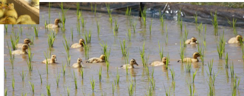
アイガモのピーちゃんも、害虫をやっつけ、元気に泳いで草の芽を浮かし、活躍してくれています。

6月のオマケは、ばあばの漬床（糶床）です。きゅうりや大根、カブ等の野菜に塗り、ビニール袋や密閉容器に入れて一晩おくだけで、本格的な浅漬けが出来ますので、是非お試し下さい。それでは、今後とも宜しくお願いいたします！