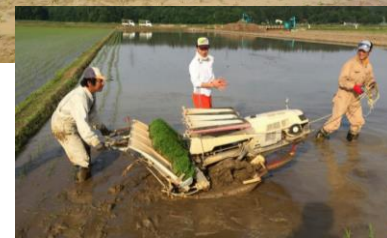
歩行田植機も埋まり、苦戦する田んぼもー。