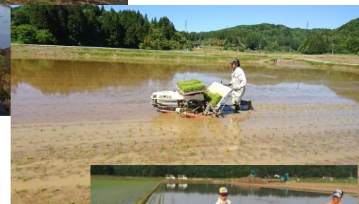
深い田んぼは歩行田植機を借りて歩く歩く！慣れないので最初はうまくいきませんが、今年はだいぶ上手になりました。（笑）