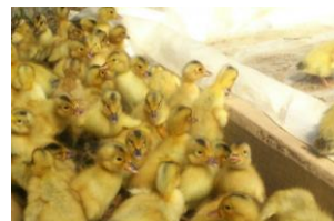
今年もピーちゃん到着！